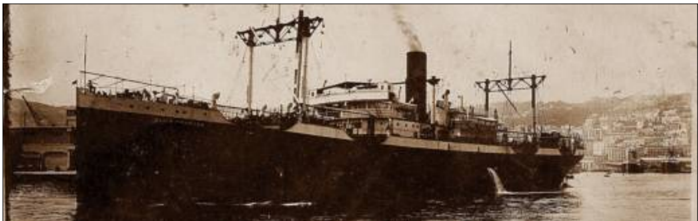
Une plaque de granit rose en souvenir des 27 marins du Saint-Prosper, imposant cargo de la Société navale de l'Ouest, a été scellée en août 2005 en haut du mât de charge qui pointe vers la surface, à trois milles de la côte. Une dernière commémoration, qui aura lieu à Rosas samedi 7 mars 2009, permettra aux familles de se rassembler dans le contexte des 70 ans de la fin de la Guerre d'Espagne.